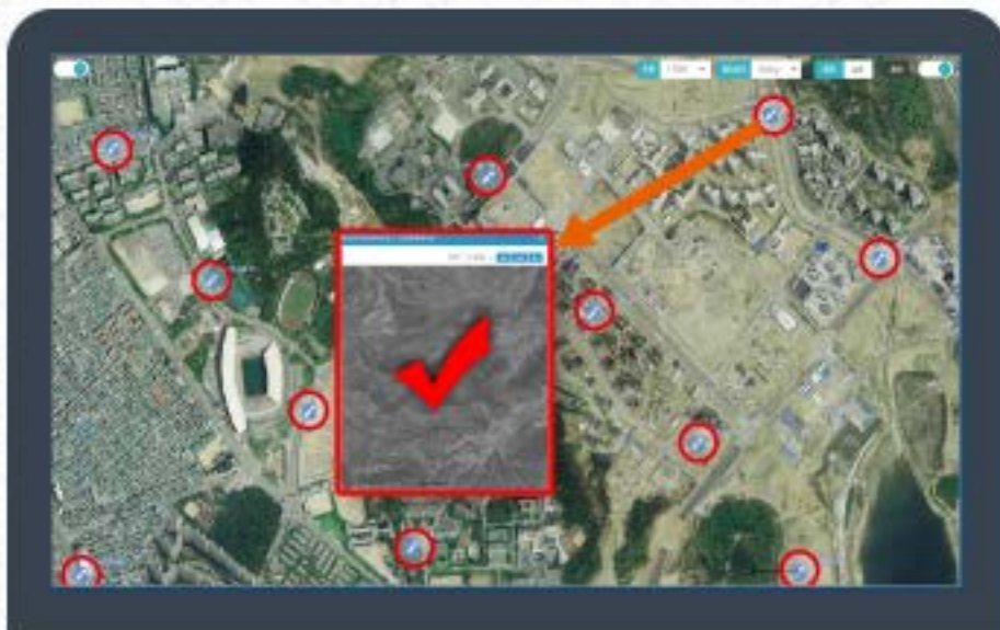
해당위치의 낯장 항공사진 팝업