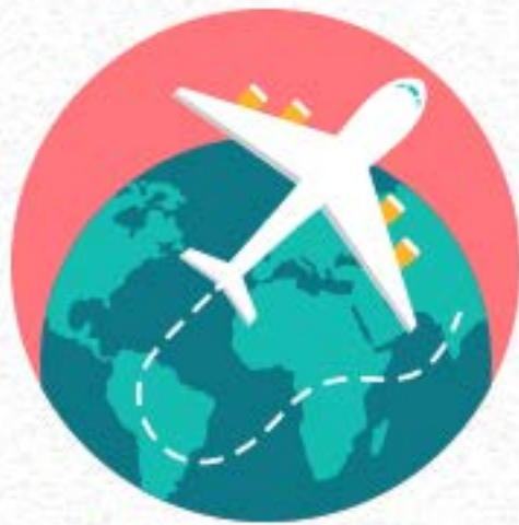
신속·정확 항공사진 판독

신속·정확한 항공사진 판독업무는 물론, 해당 위반시설물에 대한 체계적인 이력관리를 통하여 효율적인 항공사진 판독업무를 지원함으로써, 위반시설물 발생을 사전에 예방하고, 불법행위의 재발을 방지하여, 토지 및 건축행정질서 확립과 쾌적한 도시환경 조성을 위한 종합의사결정 지원체계를 제공하고 있습니다.